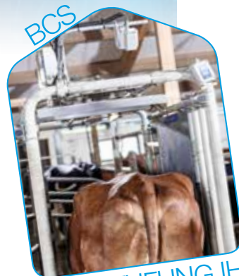
EINSTUFUNG IHRER KÜHE

Da es einfacher ist, Entscheidungen auf der Basis von großen Datenmengen zu treffen, speichert DelPro™ Farm Manager die Daten auf unbestimmte Zeit. Das bedeutet, dass Sie auf Ereignisse zurückblicken können, die in den letzten Tagen, Wochen, Monaten oder Jahren geschehen sind.